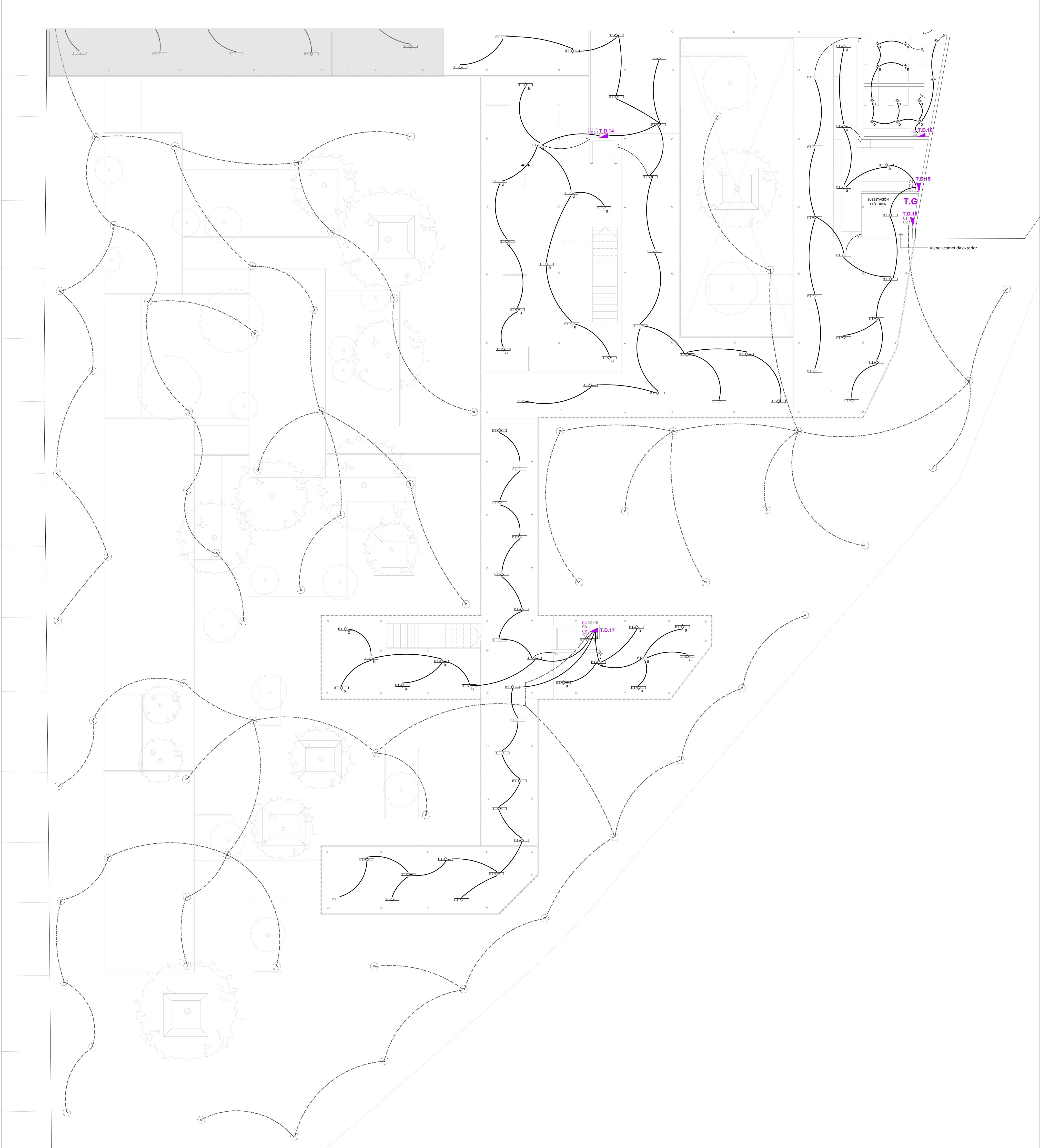
ESQUEMA GENERAL POSICIÓN DE TABLEROS